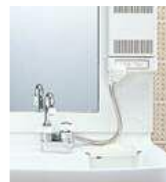
シャワーフック例